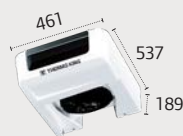
ES100N Ultra Slim