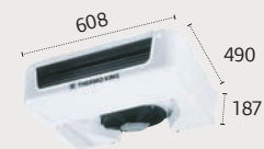
ES100 Ultra Slim