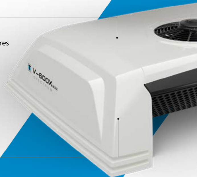
UNIDADE DE CONDENSADOR MONTADO NO TETO