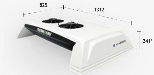
UNIDADE MONTADA NO TETO

* As alturas acima são a altura da cobertura. As alturas incluindo as ventoinhas: Montagem na extremidade - 276 mm - Montagem no teto - 273 mm