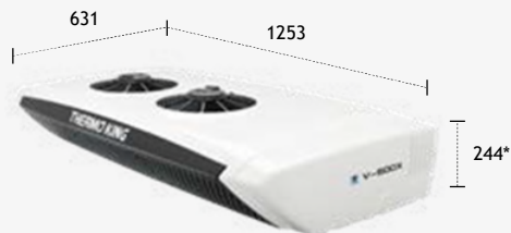
UNIDADE MONTADA NA EXTREMIDADE